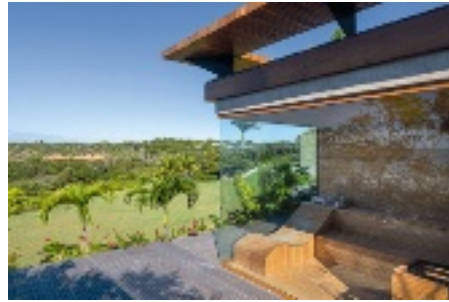
Villa à Arraial d'Ajuda, au Brésil.