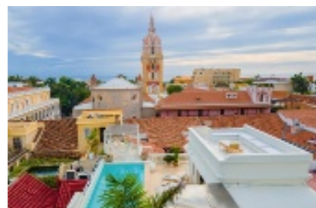
Propriété surplombant le Centre Historique de Carthagène, en Colombie.