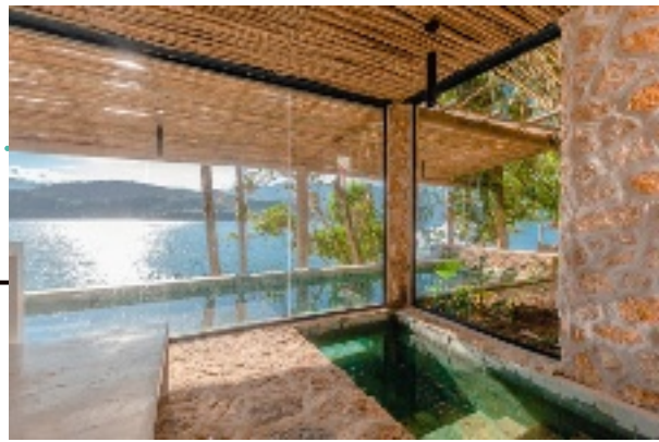
Propriété à Angra dos Reis, au Brésil.

Mélange parfait entre groupe immobilier, services de voyages et conciergerie de luxe, Latin Exclusive travaille à l'échelle mondiale à la recherche constante de nouvelles adresses.