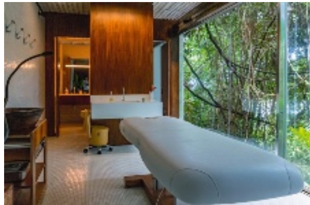
Villa à Paraty, au Brésil.