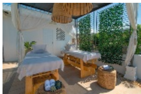
Villa dans le Centre Historique de Carthagène, en Colombie.