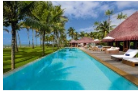
Propriété sur la plage de Trancoso, au Brésil.

Depuis 15 ans, Latin Exclusive opère pour trouver les plus belles propriétés cachées dans les endroits les plus incroyables de la planète. Créer des expériences uniques et des souvenirs inoubliables est son premier objectif, en offrant un nouveau mode de voyages haut-de-gamme à travers des locations et ventes de propriétés d'exception.