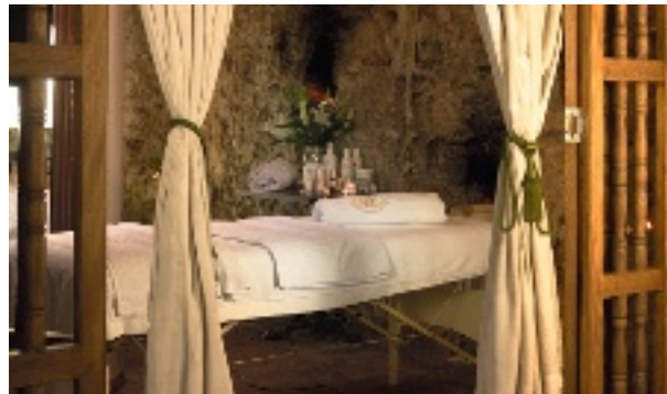
Villa dans la vieille ville de Carthagène, en Colombie.