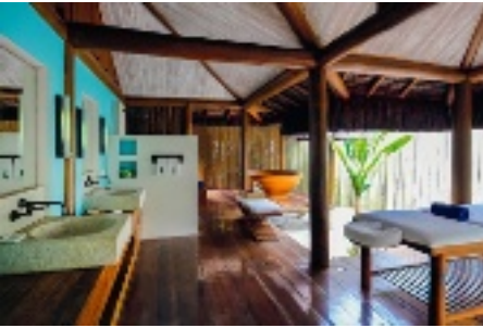
Propriété sur la plage de Trancoso, au Brésil.